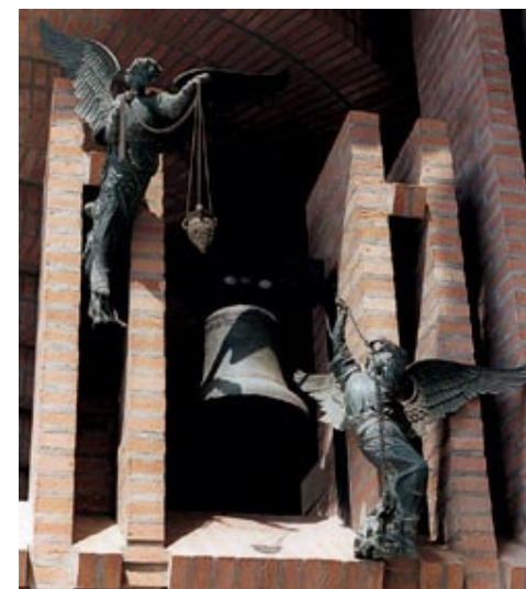
«Ricordo con emozione il suono delle campane della parrocchia di Nostra Signora degli Angeli» diceva San Josemaría Escrivá. Una di quelle campane si trova attualmente nel Santuario di Torreciudad.

Nei piccoli eventi quotidiani, vissuti con amore e alla perfezione, nelle fatiche e nelle difficoltà, nelle gioie, in un lavoro professionale eseguito bene, nel servizio alla società e al prossimo, è sempre racchiuso un tesoro. Perché il lavoro professionale e le relazioni sociali costituiscono l'ambito e